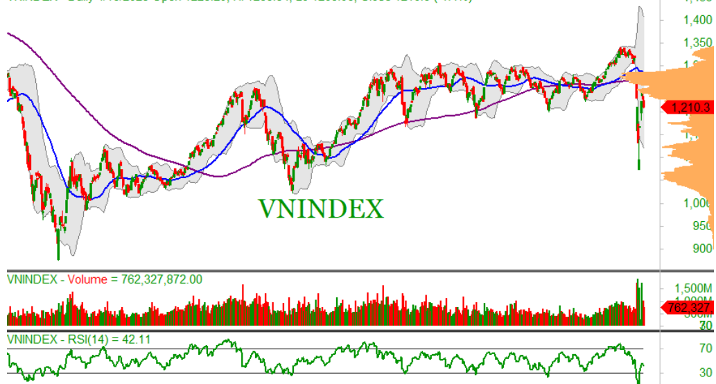
VNINDEX - Daily 4/16/2025 Open 1225.29, Hi 1233.84, Lo 1205.93, Close 1210.3 (-1.4%)

- ĐHCĐ Tổng CTCP Khoan và Dịch vụ Khoan Dầu khí (PVD). Kế hoạch 2025 doanh thu 7.200 tỷ đồng, lãi sau thuế 530 tỷ đồng, tăng 24,7% và giảm 24,1% so với cùng kỳ. Mua thêm một giàn khoan tự nâng với chi phí khoảng 2.125 tỷ đồng và Chi phí bổ sung để kích hoạt giàn khoan mới dự kiến từ 10-15 triệu USD. PVD đã mua lại giàn khoan tự nâng từ Seadrill Prospero (T12/2024) và dự kiến hoạt động từ tháng 8/2025.