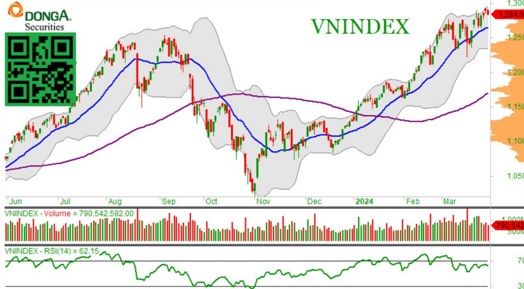
VNINDEX - Daily 3/29/2024 Open 1290.18, Hi 1293.04, Lo 1282.44, Close 1284.09 (-0.5%)

Danh sách chi tiết khuyến nghị vui lòng xem trang 2.